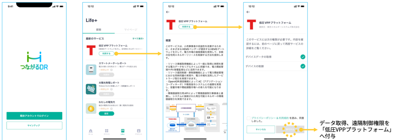
モバイルアプリ「つながる DR」と低圧VPPプラットフォームとのサービス連携手順

NextDriveはIoTプラットフォームを通じて幅広いコネクティビティを提供し、各種アプリケーション、プラットフォームを提供する事業者様とのオープンな連携を目指しています。脱炭素化の推進やエネルギー価格高騰を背景として、引き続きニーズの高まるエネルギーマネジメントシステムの高度化に注力してまいります。